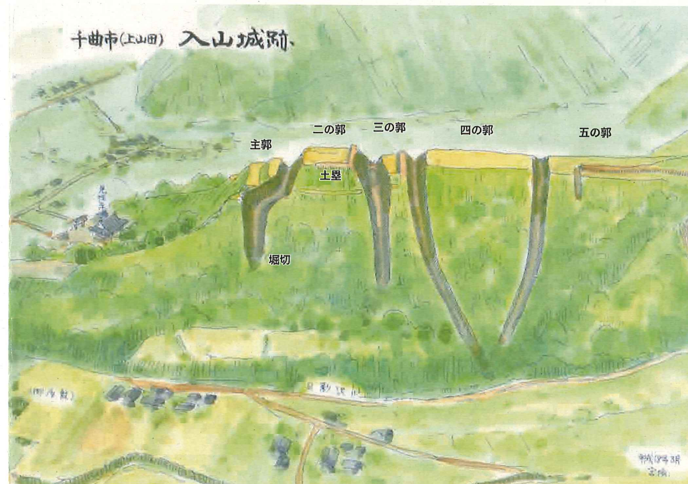
宮坂武男氏による入山城の鳥瞰図 (長野県立歴史館所蔵)

The castle features 4 trenches cut in the north side of the ridge. They are among the most easily-distinguished trenches remaining in the city. The castle is made up of 5 baileys. Earthen ramparts can be seen on the 2nd and 3rd baileys. From the west bailey are the remains of a channel that is thought to have brought water from a pond in Urushibara.