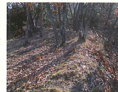
二の郭に残る土塁